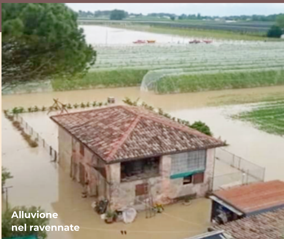
Alluvione nel ravennate

E allora ecco che la "festa" del Macfrut si è tramutata nella triste consapevolezza che i nostri amici avrebbero avuto (purtroppo) altro da fare e altro di cui preoccuparsi. Siamo costernati per chi ha perduto persone care e solidali con chi ha