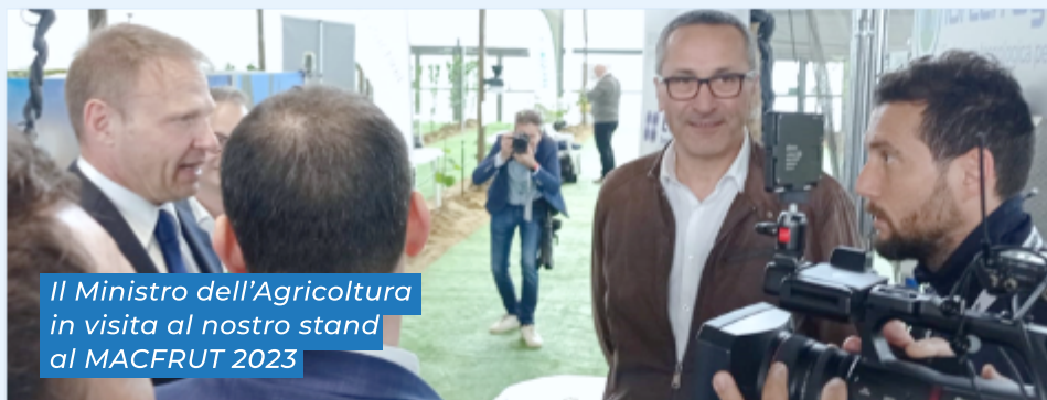
Il Ministro dell'Agricoltura in visita al nostro stand al MACFRUT 2023

Anche quest'anno la rassegna del MacFrut non ha deluso le aspettative e l'affluenza è stata altissima, specialmente nella giornata centrale di giovedì 4 maggio. Come prevedibile, in virtù del forte interesse che ormai da mesi ruota attorno al tema "agrivoltaico", lo stand di iGreen System [società nata dalla collaborazione tra Romagna Impianti ed Eco Energia di Castel Guelfo, Bologna] è stato letteralmente preso d'assalto! Il nostro modello espositivo di Agrivoltaico Avanzato (in scala 1:2) ha attirato l'attenzione di tanti imprenditori agricoli e degli addetti ai lavori in generale. Inoltre, nel convegno tenuto in sala B1, abbiamo avuto l'opportunità di fare il punto della situazione attuale in relazione agli aspetti normativi.